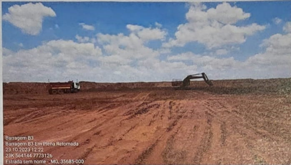
Escavação realizada por conjuntos escavadeiras e caminhões basculantes.

Para a caracterização da estrutura e elaboração de seu projeto executivo foram demandados serviços de investigação direta e indireta, incluindo: